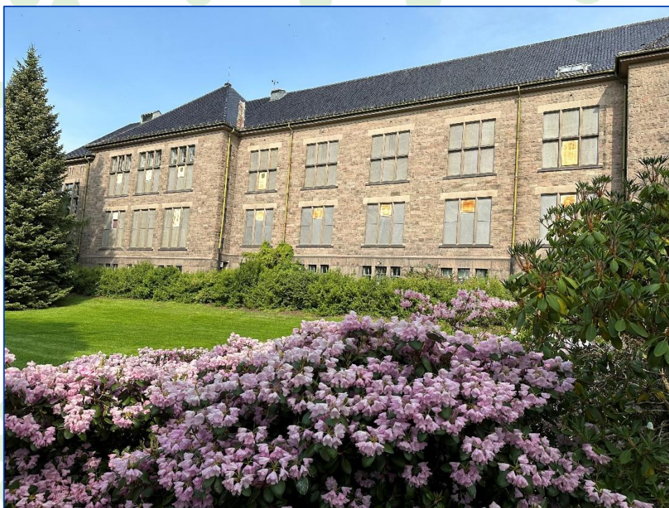
Naturhistorisk museum, Universitetet i Oslo, Anno 2023