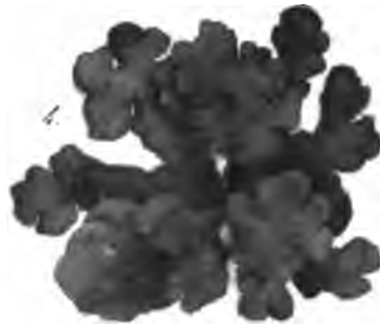
Sticta hirsuta Montg.