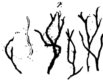
Parmelia leucomela var. angustifolia forma multifida .