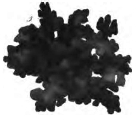
Sticta lurida M. et Fw.