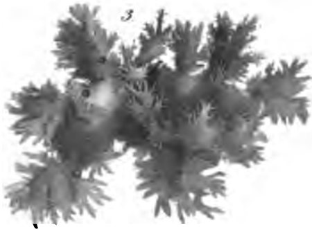
Sticta variabilis , Ach. var. polyschista .