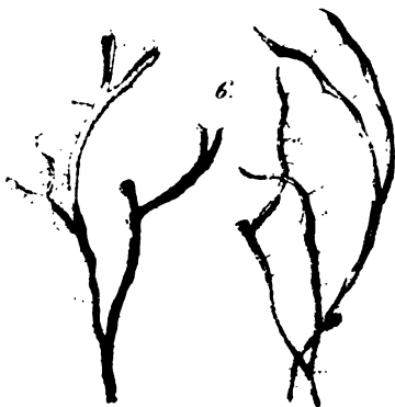
Parmelia leucomela var. angustifolia .