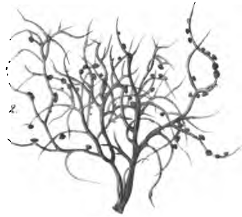
Ramalina costata , M. et Fw.