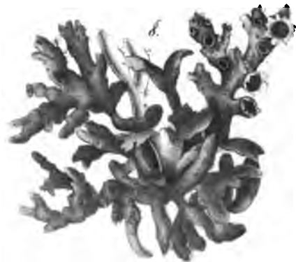
Parmelia leucomela var. latifolia .